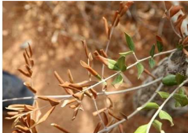
et finalement Dépérissement