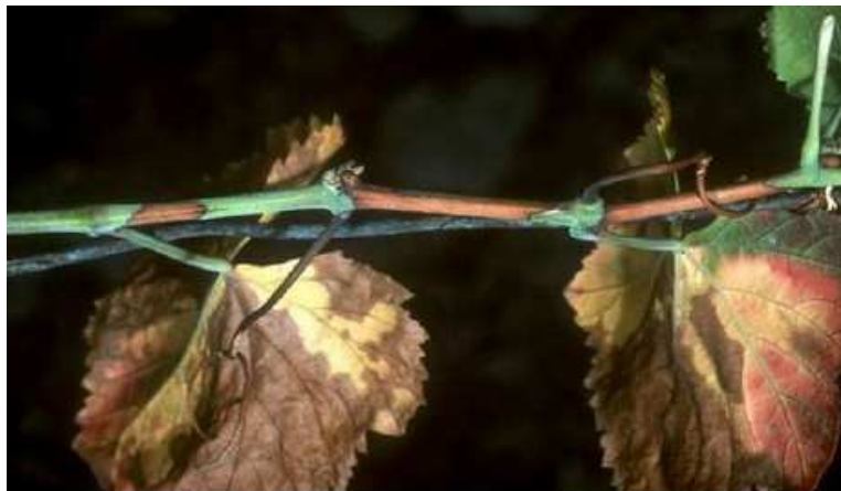
Xylella fastidiosa sur Vitis vinifera

Le non-aoûté au niveau des nœuds est un symptôme spécifique qui doit fortement alerter.