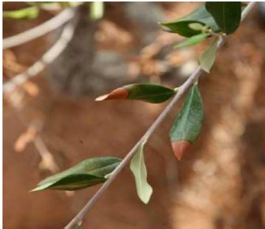
Brunissement foliaire à Xylella fastidiosa sur Olea europaea

http://agriculture.gouv.fr/sites/minagri/files/xylella_fastidiosa_symptomes_et_risques_de_confusions_biotiques_et_abiotiques_dgal-1.pdf