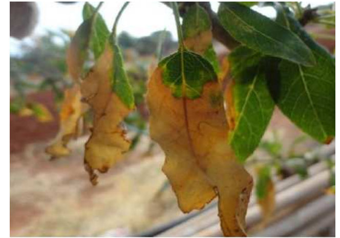
Brunissement foliaire à Xylella fastidiosa sur Prunus amygdalus