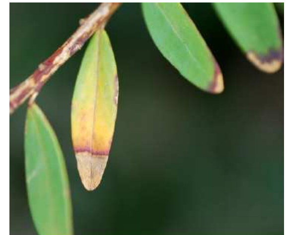
Brunissement à Xylella fastidiosa sur Polygala myrtifolia