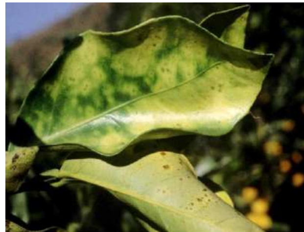
taches chlorotiques typiques de Xylella fastidiosa sur Citrus sinensis

Le non-aoûté au niveau des nœuds est un symptôme spécifique qui doit fortement alerter.