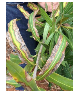
Nerium oleander (Laurier rose)

En cas de suspicion, contacter immédiatement le SRAL Bretagne pour une inspection officielle. Assurez vous au préalable que la plante a été correctement arrosée (sans excès) et qu'elle fait partie des végétaux sensibles à Xylella fastidiosa .